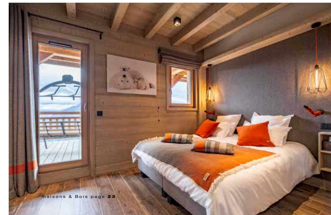
↓ Pour les chambres, comme pour le salon, le choix s'est porté sur un carrelage imitation parquet pour un entretien plus facile.