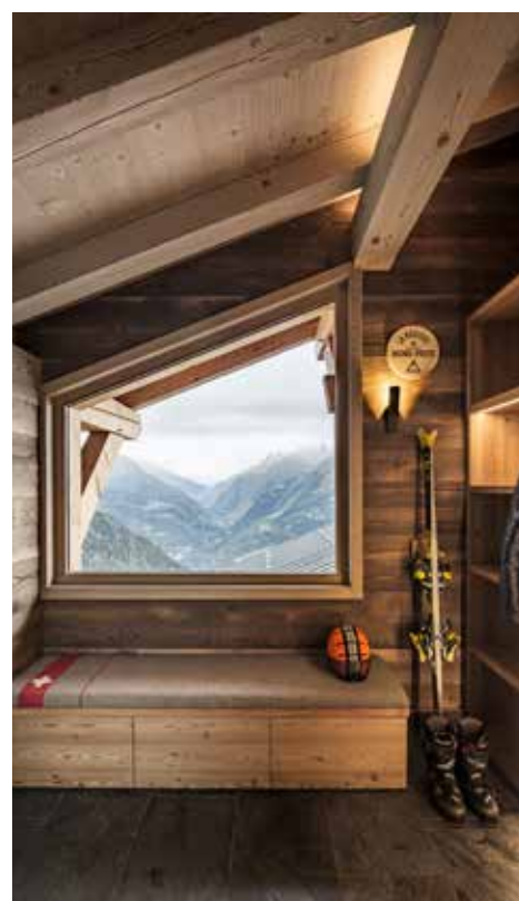
Au premier étage on retrouve un ski room en bois thermotraité avec une vue incroyable.