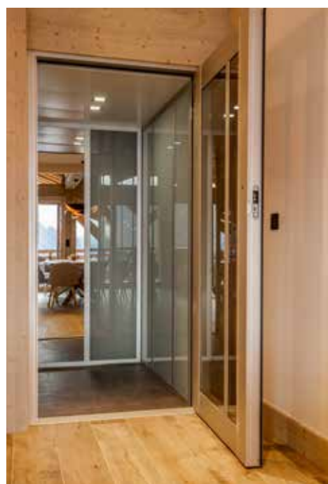
Soucieux de pouvoir accueillir les personnes à mobilité réduite, le chalet a été pensé afin de permettre à tous de se sentir bien. L'Ours de La Rosière propose ainsi un ascenseur desservant 4 étages, une chambre, une salle de bains et des wc spécialement équipés avec notamment des ouvertures automatiques. L'espace de vie spacieux permet à un fauteuil roulant de circuler aisément.