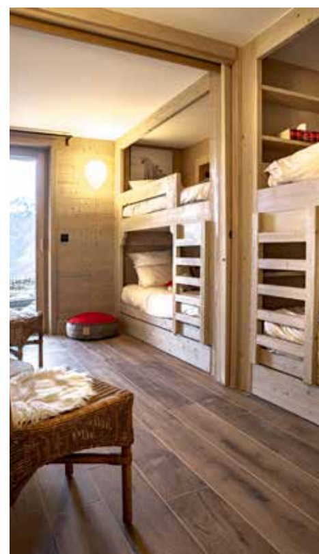
Ce dortoir est un lieu rêvé pour des enfants. C'est là encore l'œuvre des menuisiers du constructeur.

« tout le monde n'a pas le même rythme ou les mêmes envies aux mêmes moments. Surtout quand le chalet est complet et que l'on est 14 ! Et puis il fallait que l'on puisse s'occuper lorsque la météo ne permet pas de sortir. » Ce n'est pas qu'un chalet, c'est leur chalet ! A leur image, avec leur personnalité.