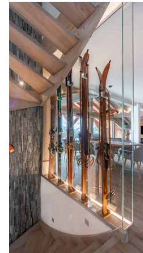
Un garde-corps vitré original pensé par le propriétaire. Une vitrine avec des skis retraçant l'évolution du matériel de 1890 à nos jours.

sur le chantier. On a choisi les matériaux, des artisans locaux pour mettre en avant leur savoir-faire, des équipements, la déco, des objets artisanaux originaux, les systèmes domotiques (chauffage, lumière) ou encore les équipements. Cet investissement personnel était obligatoire. Il fallait que ce soit un lieu où l'on se sente bien avec la famille, les enfants, un jour les petits-enfants ou encore les amis. Même si nous le mettons en location (voir carnet d'adresses), nous en profitons pour les vacances, mais c'est surtout un endroit où l'on vivra un jour c'est certain ! Il fallait donc qu'il nous ressemble, conforme à nos goûts et nos envies. Je dis souvent à mes amis de ne pas chercher de maison de retraite. Plus tard, on s'installera ici. On voulait un lieu où l'on puisse se retrouver, mais que chacun ait son indépendance. Il fallait que ce soit convivial, chaleureux. Que l'on s'y sente comme à la maison. Ce qui est important car