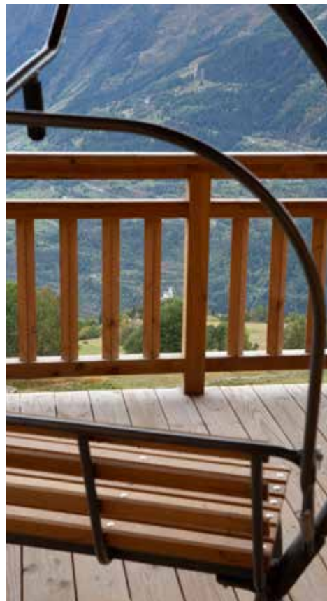
Taninges Télécabines a rénové et transformé un vieux télésiège 3 places en un strapontin original pour admirer la somptueuse vue.