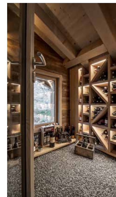
Ses aménagements haut de gamme (jacuzzi 7 places, sauna, cave à vin, salle TV/Bibliothèque, salle de jeux avec billard, baby-foot et discothèque) en font un lieu au confort sans faille. Au premier étage on trouve une cave à vin en bois thermotréité avec du gravier de Marlens gris anthracite (issus de la carrière locale) et une climatisation de cave intégrée dans les placards adjacents.