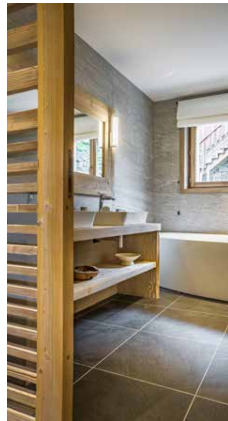
Dans les salles de bain on retrouve un carrelage de grands formats ton pierre pour rester dans l'esprit montagne et des meubles vasques en bois sur mesure réalisés par Grosset Janin.