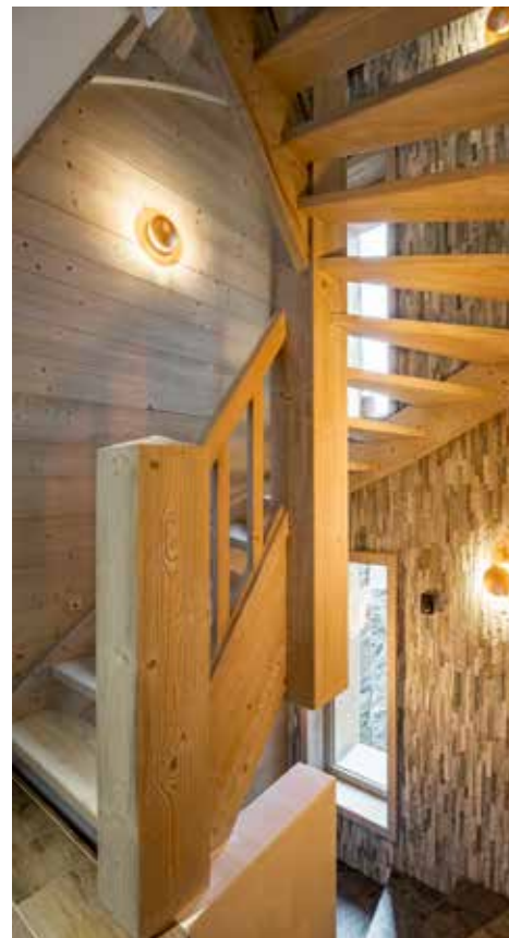
Les étages sont desservis par des escaliers aux marches en frêne pour une meilleur longévité.