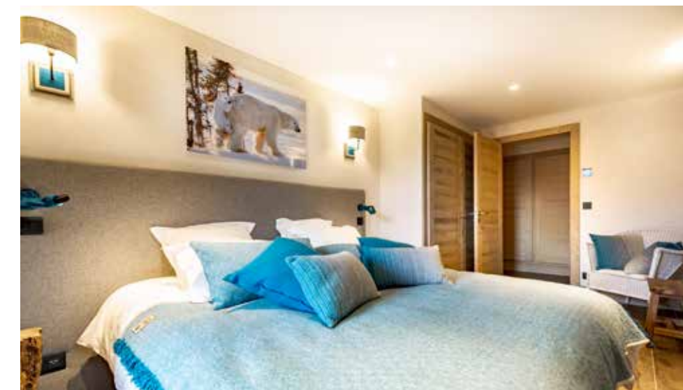
↑ Dans les suites et les chambres, la filature Arpin a su créer un univers chaud et chaleureux où le luxe et la décontraction se marient harmonieusement.