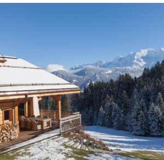
Face au Mont-Blanc ! L'une des volontés des clients était de bénéficier de la vue. Le chalet a été conçu pour pouvoir profiter du toit de l'Europe sans modération.

Un chalet, même très haut de gamme, n'est pas forcément synonyme de démesure. Il peut arborer une certaine simplicité où le bois suffit à le rendre exceptionnel et où le bien-être est peut-être le plus grand luxe. C'est ce qui se dégage de cette réalisation signée par le constructeur Grosset Janin. Ne nous y trompons pas, elle possède bien tous les éléments d'un programme de haute volée. Simple, il s'en échappe également une sensation agréable de chaleur et d'accueil, quelque chose d'indéfinissable, qui nous en fait presque oublier ses prestations. C'est ce supplément d'âme qui nous fait prendre conscience du privilège que nous avons de visiter et présenter des chalets aux ambiances raffinées où le travail du bois est sublimé.