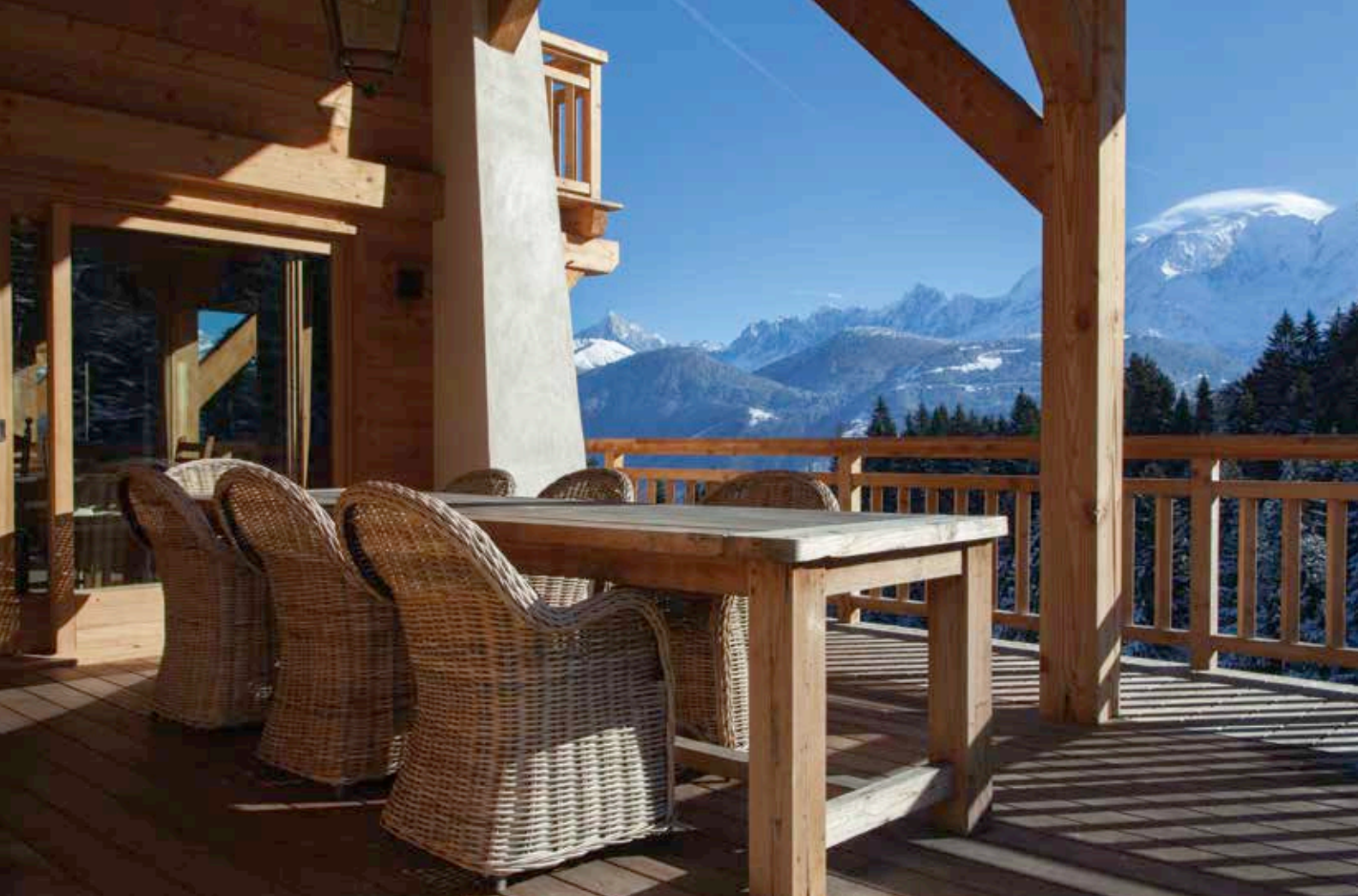
La terrasse se couvre de belles lames d'ipé. Bois résistant, dense et lourd, il se pose sans crainte en extérieur. Imputrescible, il ne craint pas les intempéries, fait face aux agressions quotidiennes et aux variations de températures.